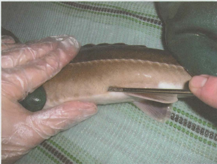
Obr. 1: Biopsie gonád jesetera malého ( A. ruthenus ) pomocí trokaru vedeného kranio-mediálním směrem v břišní partii před bází břišní ploutve.