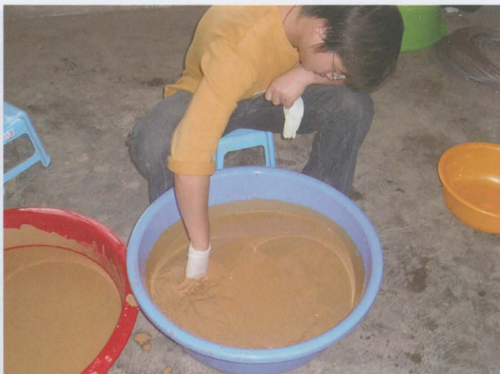
Obr. 15: Odlepkování jiker v suspenzi jílu.

V edici Metodik (Technologická řada) vydala Jihočeská univerzita v Českých Budějovicích Výzkumný ústav rybářský a hydrobiologický ve Vodňanech. - Náklad 100 ks – Technická realizace: PTS spol. s r.o. Vodňany – Předáno do tisku: květen 2008