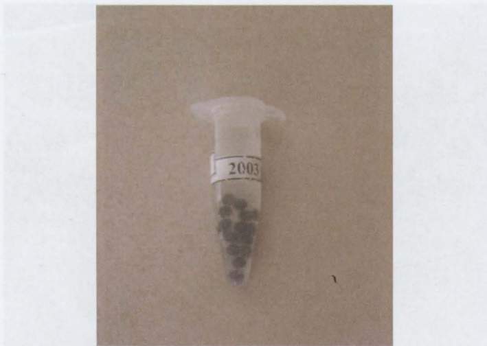
Obr. 2: Umělohmotná zkumavka typu Eppendorf o objemu 1,5 ml se vzorkem ovocytů fixovaných v Sérově roztoku.