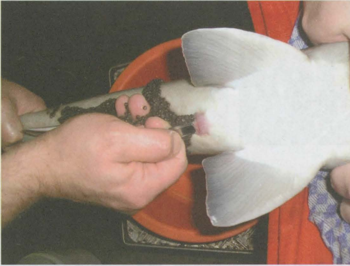
Obr. 7 a, b, c: Výtěr jikernačky jesetera sibiřského mikrochirurgickou metodou s proříznutím vejcovodu.