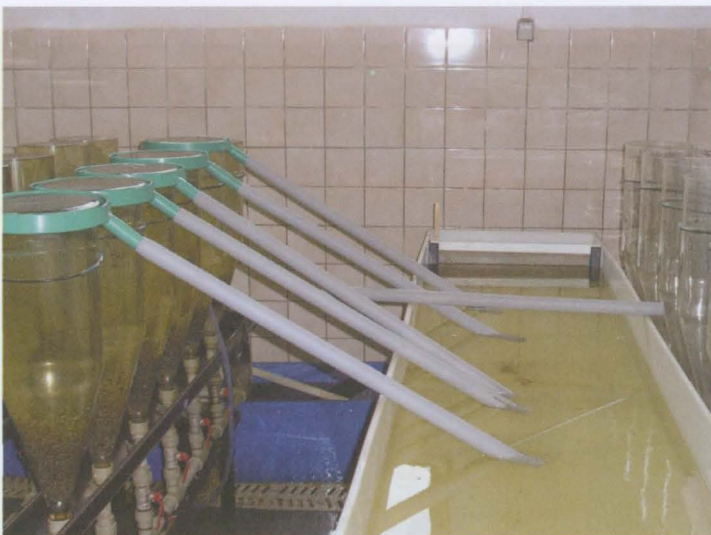
Obr. 10: Přeplavování plůdku jesetera do odchovného žlabu.