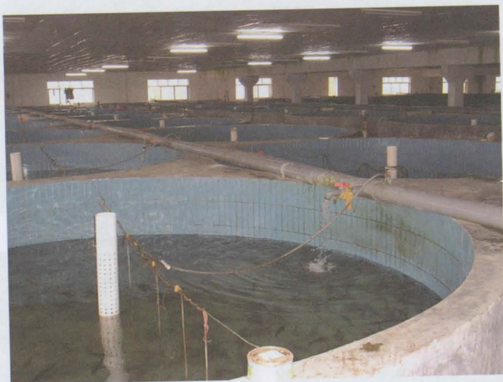
Obr. 12: Kruhové bazény rybí líhně Taihu Lake pro odchov jesetera čínského ( Acipenser sinensis ). Těchto bazénů o průměru 3 m je v hale 120.