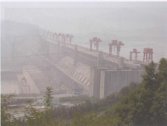
Obr. 11: Největší přehrada světa „Tři soutěsky“ na řece Yangtze.