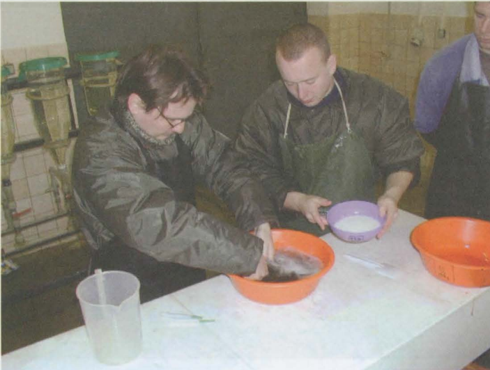
Obr. 8: Oplození jiker s pomalým promícháváním a postupným přidáváním odlepkovací suspenze.