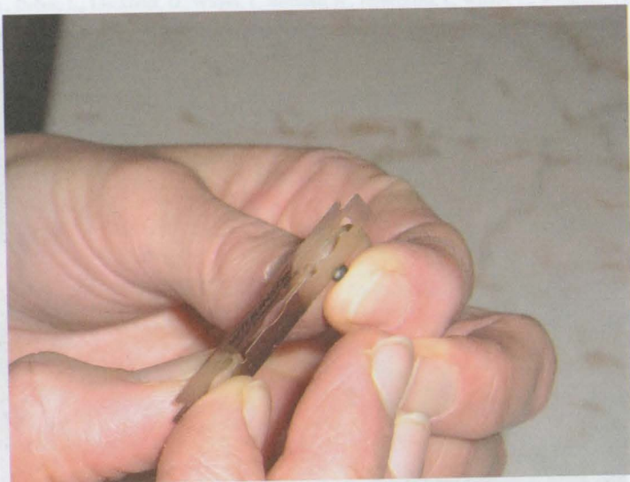
Obr. 3: Rozříznutí fixovaného ovocytu v podélné rovině žiletkou.