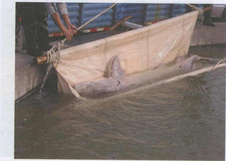
Obr. 13a, b: Přeprava a vysazení jikernačky jesetera čínského (330 kg, 3,5m délky) do přípravného bazénu.