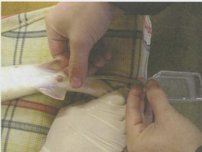
Obr. 5: Odběr spermatu jesetera malého pomocí kanyly do kontejneru o objemu 50 ml. Vlastní odběr trvá maximálně 1 minutu.