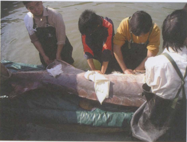
Obr. 14: Vlastní výtěr jikernačky jesetera čínského