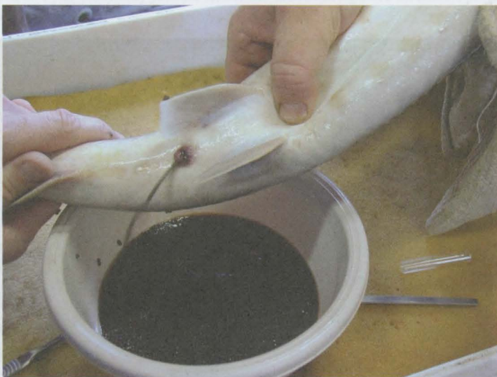
Obr. 6: Výtěr jikernačky jesetera malého (po proříznutí vejcovodu mikrochirurgickou metodou).

Obr. 7: Opatření jako oporou při přemíchávání a používání plynového odčerpávacího systému.