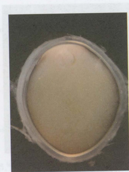
Obr. 4: Optimálně zralá jikra jesetera malého se zřetelně viditelným jádrem.