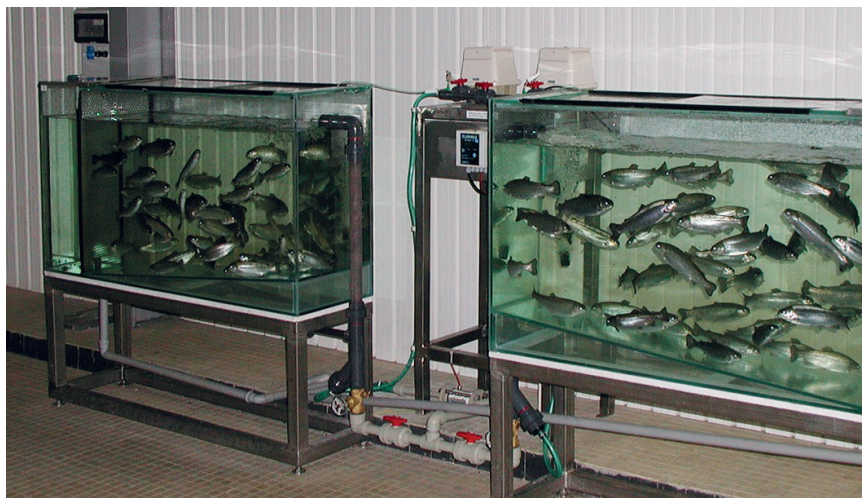
Obr. 2. Fotografie instalované biomonitorovací jednotky.

V – vzduchovací motůrek (kompresor); S – světlo (2 x 15 W); K – kryt nádrže (s odnímatelnou částí pro krmení); P – přítok vody; O – odtoková trubka (odnímatelná, pro odkalování); D – dno nádrže (vyspádované směrem k odtoku); R – recirkulace (filtr + čerpadlo); M – mřížka oddělující prostor odtoku