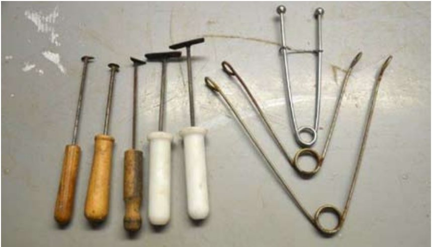
Obr. 6. Škrabky pro odstraňování podkožního tuku (vlevo) a rozvírače úst (vpravo).

Před zahájením preparace je nutné připravit si pracovní plochu a pomůcky (obr. 5). Rozhodujícím faktorem je právě příprava pracovního místa, které musí být po celé ploše dobře osvětleno. Ze zdravotních důvodů je důležité zajištění odvětrání výparů z formaldehydu, který je v průběhu preparace použitý jako fixační činidlo pro denaturaci bílkovin. Pracujte proto v dobře větrané místnosti nebo digestoři. Jako pracovní podložku je nutné použít měkký materiál (např. molitan), který se během procesu preparace přizpůsobí tvaru hlavy. Zároveň udržuje vlhkost, která brání oschnutí povrchu. Velikost podložky musí odpovídat velikosti preparované hlavy. V tento okamžik je vhodné rozmyslet finální podobu preparátu. Především orientaci ploutví a stupeň rozevření úst a skřelí.