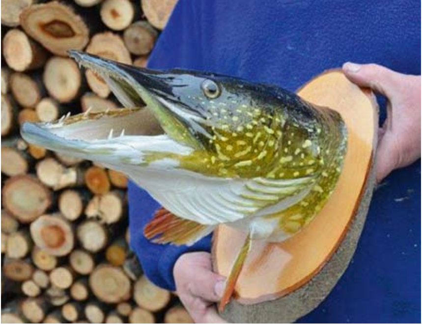
Obr. 25. Finální podoba preparované hlavy štiky na dřevěné podložce

Další možností je použití vyřezávaných podložek z dřevěných fošen. V tomto případě je možné připravit podložky nejrůznějších tvarů včetně ozdobných reliéfů. Opět závisí na vkusu a možnostech preparátora nebo požadavku zákazníka.