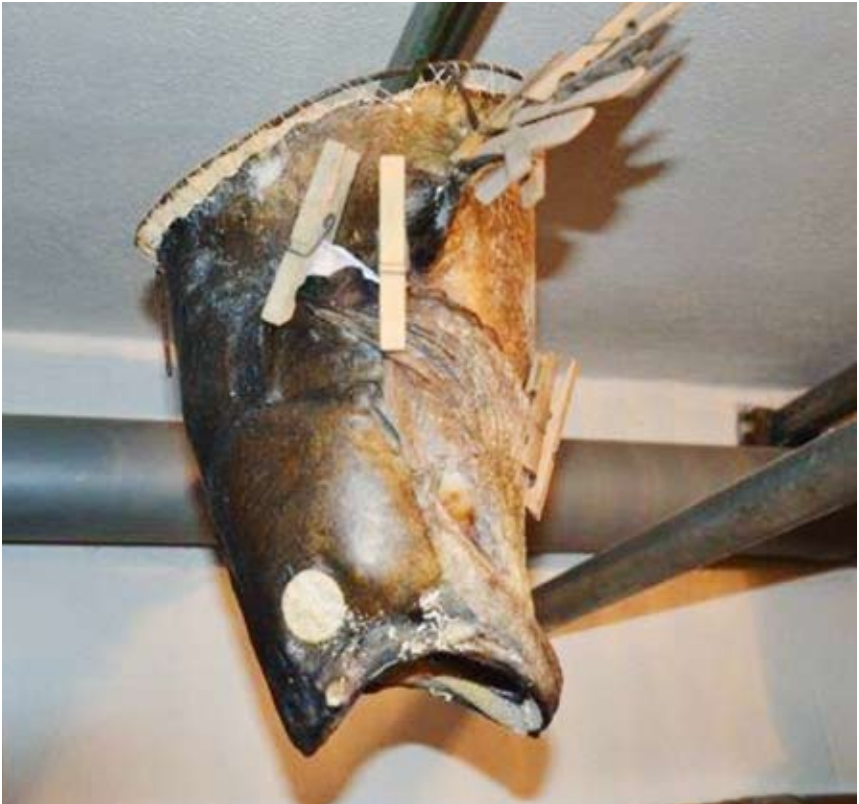
Obr. 18. Sušení hlavy sumce velkého ( Silurus glanis ) ve volném prostoru na kovové konstrukci.

Pro kvalitní a dokonalé vyschnutí preparátu je nutné zajistit vhodné suché místo s dostatečnou cirkulací vzduchu a s teplotou od 20 do 30 °C (obr. 18) (Nebeský a Bláha, 2012). Při nedodržení těchto hodnot může dojít k rozvoji plísní na povrchu nebo v ústní dutině. V případě jejího vzniku doporučuji místo ošetřit tamponem s 20% roztokem formaldehydu a upravit proudění vzduchu kolem preparátu.