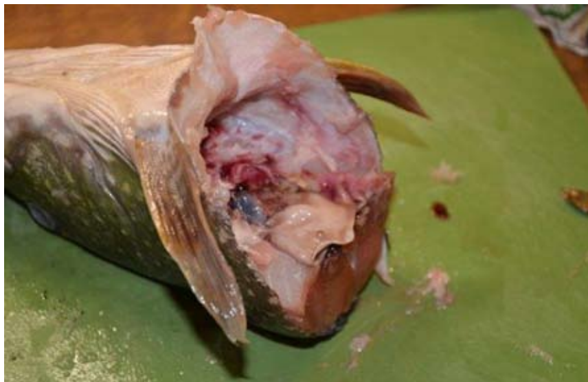
Obr. 7. Z hlavy a části trupu postupně odstraníme všechny měkké tkáně.

odřízneme kůži od svaloviny. Svalovinu následně rozřežeme na větší kusy a pomocí peánu odstraníme (obr. 7). Tímto způsobem odstraníme většinu svaloviny a měkkých tkání. Tato fáze je relativně časově náročná, je proto nutné povrch hlavy udržovat neustále vlhký. Vzhledem k použití skalpelů je nutné postupovat obezřetně, neboť hrozí proříznutí kůže. Pro přestřihnutí kostí ploutví nebo páteře je vhodné použít kleště. Po této fázi hrubého odstranění svaloviny a většiny kostí následuje dočištění kůže od zbytků svaloviny a případné odstranění podkožního tuku pomocí škrabky.