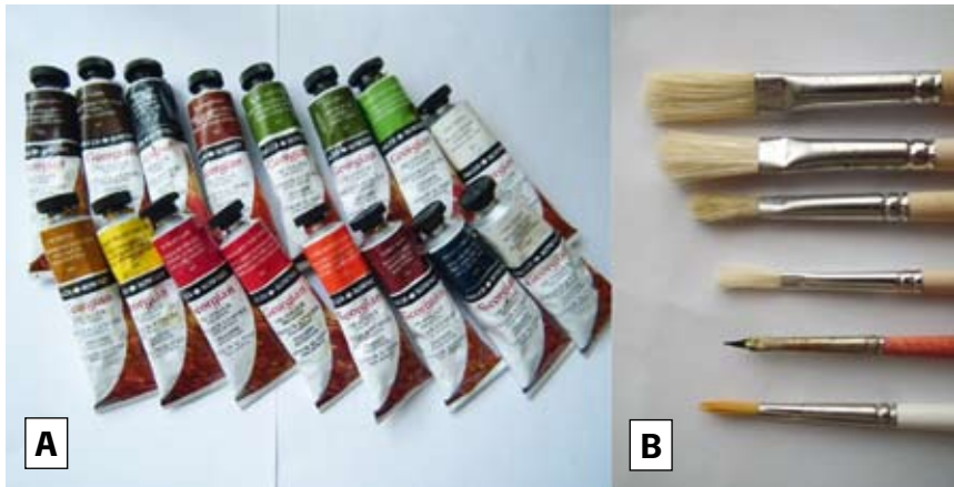
Obr. 23. Pro barvení preparátu se používají různé druhy štětců (A) a olejových barev (B).

V zásadě se barvení rybích hlav neliší od barvení celých ryb a patří mezi kritické fáze celého procesu preparace. Použitím nevhodných barev lze preparát snadno znehodnotit, neboť barvení vyžaduje cvik a jistou dávku uměleckého citění a umu. Pro dobarvení rybích preparátů jsou vhodné olejové barvy (obr. 23A), k jejichž nanášení lze použít ploché nebo kulaté štětce určené pro olejomalbu (obr. 23B). Barvy lze míchat na paletě, případně přímo na preparátu.