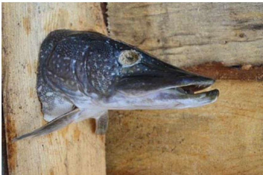
Obr. 14. Očištěná hlava štiky připravená pro fázi sušení.