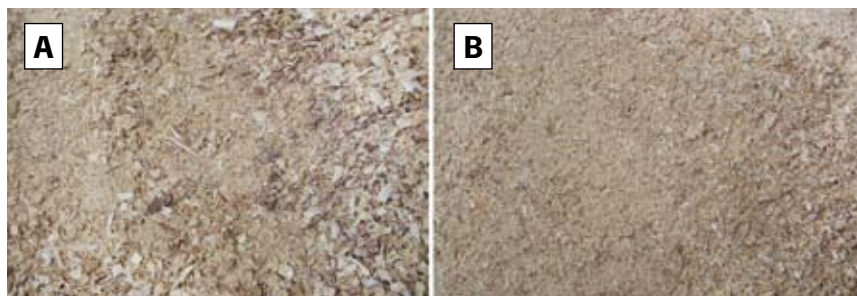
Obr. 10. Hrubé piliny (A) je nutné prosít, abychom dosáhli jemných pilin (B) vhodných k použití do směsi se sádrou.

Hlavu je nutné, po vyjmutí z roztoku formaldehydu, řádně opláchnout v čisté vodě. V případě použití silnější než doporučené koncentrace roztoku formaldehydu je vhodné hlavu ponechat v čisté vodě 10–20 min. Plnicí směs si připravíme z jemných pilin (obr. 10) a modelářské sádry. Pro vylehčení směsi je možné použít perlit nebo polystyren v poměru do 1/3 objemu směsi (obr. 11). Ve vhodné nádobě k pilinám a perlitu přidáme vodu tak, aby směs