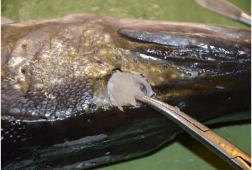
Obr. 8. Pro odstranění svaloviny z lícní části použijeme peán.