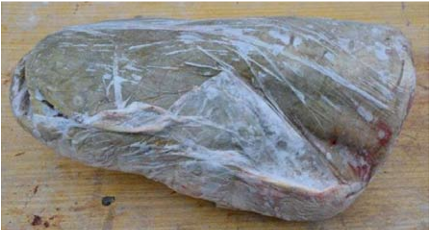
Obr. 3. Zmrazená hlava sumce velkého ( Silurus glanis ) těsně zabalená do PE sáčku

Abychom předešli rozvoji mikroorganismů na povrchu kůže a žábřách, nebo oschnutí pokožky a ploutví, je nutné provést rozmrazení hlavy co nejrychleji ve vodní lázni. Pro rozmrazení je vhodná nádoba odpovídající velikosti s vodou o teplotě 20\text{--}25\text{ }^{\circ}\text{C} . Hlava musí být celá ponořená, aby došlo k rovnoměrnému povolení svaloviny. V počáteční fázi rozmrazení lze doporučit ponechání těsně přiléhajícího obalu na kůži. Z důvodu lepší práce se skalpelem doporučuji nechat hlavu rozmrazit pouze do hloubky 3–6 milimetrů (obr. 4). Rozmrazená svalovina je totiž obvykle měkká a rozbředlá .