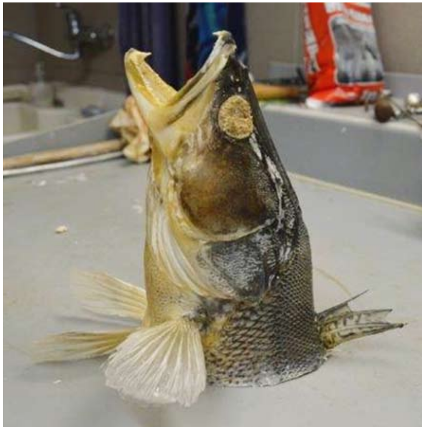
Obr. 19. Preparát očistíme od nečistot a upravíme drobné vady (candát obecný, Sander lucioperca ).

Odstraníme fixační kartony a spony z ploutví a jemným štětcem očistíme celý povrch ryby (obr. 19). Různé výstupky a odchlíplé šupiny seřízneme skalpelem a zabrousíme smirkovým papírem.