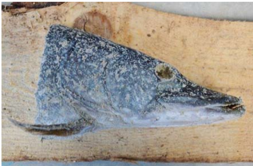
Obr. 13. Preparát je nutné před další fází řádně očistit od zbytků plnicí směsi, která ulpívá na povrchu.