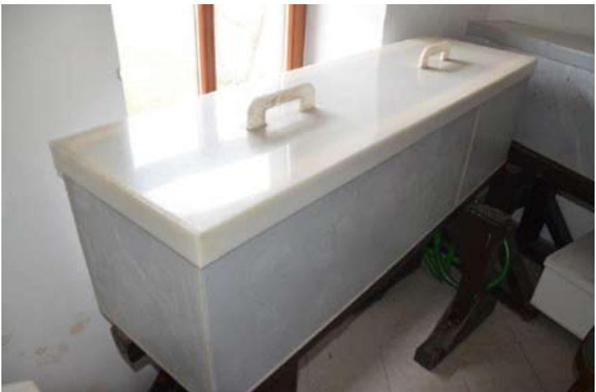
Obr. 9. Speciální plastové nádrže určené pro lázeň ve formaldehydu.