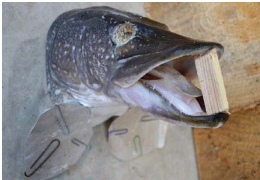
Obr. 17. Konečná pozice preparátu hlavy štiky před jeho vyschnutím.