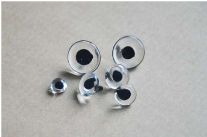
Obr. 21. Křišťálové rybí oči s oválnou pupilou.