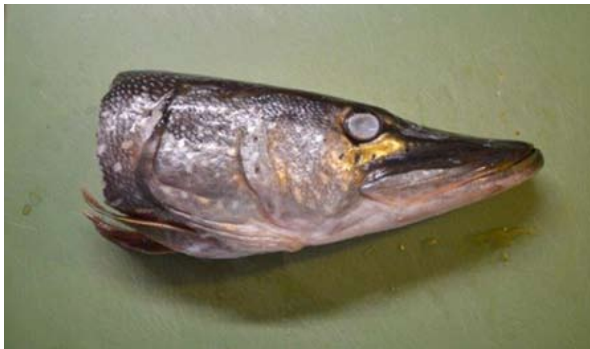
Obř. 4. Rozmrazená hlava štiky obecné ( Esox lucius ) připravená pro preparaci.