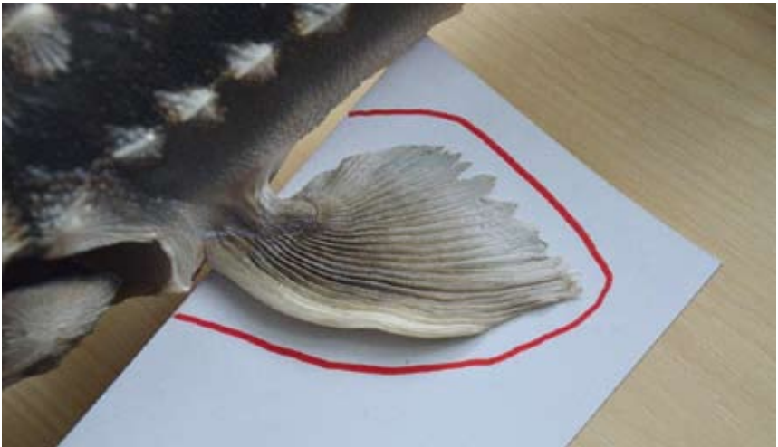
Obr. 15. Příprava ploutve jesetera hvězdnatého ( Acipenser stellatus ) k fixaci pomocí kartonu.

Po zafixování ploutví je nutné rozevřít čelisti a skřele. Zde záleží na vkusu preparátora. Dle vlastních zkušeností je vhodnější fixovat čelisti v mírnějších a přirozenějších pozicích. Pro fixaci rozevřené čelisti použijeme speciální rozpínák, případně dřevěný kolík. Závěrečnou činností této fáze je umístění hlavy na sušák a naaranžování do finálního tvaru, ve kterém bude vysychat (obr. 17).