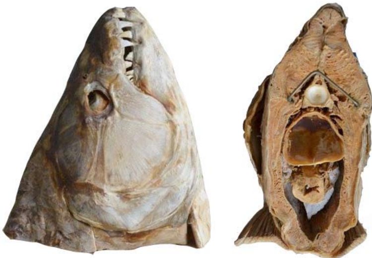
Obr. 1. Nevhodně a primitivně zpracovaný preparát bingy tygří ( Hydrocynus goliath ).

Zásadním krokem při přípravě jakéhokoliv preparátu ryby je jeho dobarvení, případně povrchové vytmelení nerovností. Díky použitým chemikáliím a fyzikálním procesům při jeho výrobě totiž dochází ke ztrátě původního zbarvení hlavy a k deformacím povrchu kůže. V případě trofejí z ryb s větším podílem měkkých tkání na hlavě (sumec, kapr, lososovité ryby apod.) je proto nutné vzniklé nedokonalé plochy vytmelit, zbrousit a vrátit tak hlavě původní tvar. Pro následné dobarvení preparátu existuje bezpočet technik jak dosáhnout původního zbarvení ryby. Nejčastější metodou je použití štětců a vodových, akrylových nebo olejových barev (Nebeský a Bláha, 2012). Pro dosažení nejlepšího výsledku dobarvení preparátu včetně nejjemnějších detailů je vhodné použít metodu tzv. airbrushu (Hall a Saxton, 1987). V USA nabývá na popularitě příprava tzv. rybích reprodukcí. Jedná se o odlitky ryb ve speciálních formách, které jsou následně upraveny dle podoby originálu. (např. firma Advanced taxidermy http://www.advancedtaxidermy.com/ , či preparátor Daniel Hroch, http://www.fishland.cz/ ).