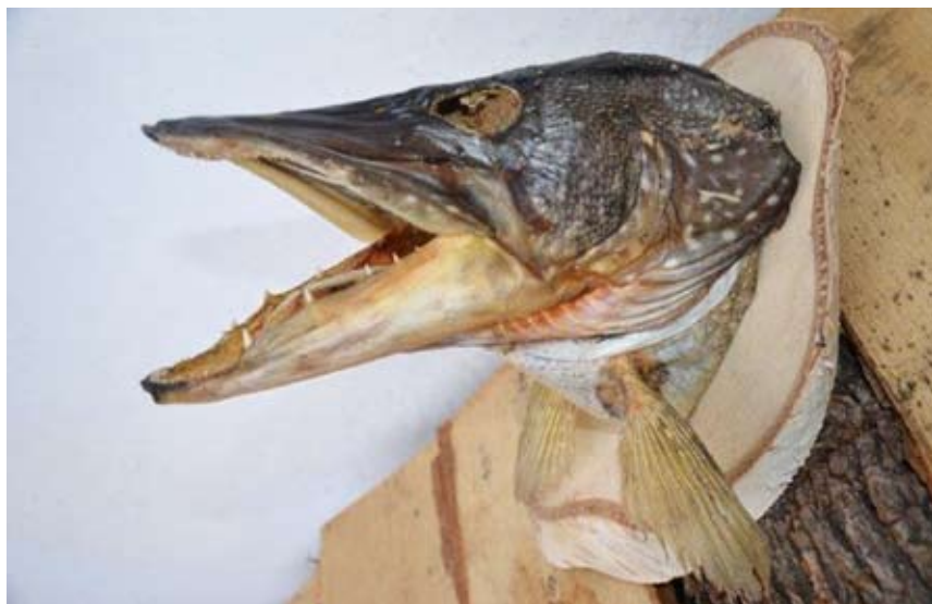
Obr. 26. Nevhodně připravený preparát hlavy štiky.

Na obr. 26 je příklad nevhodně zvoleného postupu preparace, při kterém je estetická stránka preparátu značně diskutabilní. Vzhledem ke zvolené metodě preparace je rovněž snížena doba životnosti preparátu. Při přípravě preparátu nebyl pravděpodobně použit žádný fixační prostředek a hlava byla pouze zbavena svaloviny a vysušena. V místech, kde zůstala neodstraněná svalovina, jsou známky po působení hmyzu. Tmavá místa pod kůží jsou naopak způsobena přítomností plísňe. Základní chybou, která od počátku znehodnotila preparát, bylo oddělení hlavy od těla ihned za skřelemi. Ve finální úpravě byl použit pouze bezbarvý lak bez dobarvení kůže. Zcela chybí náhrada očí. Rovněž byla zvolena příliš malá dřevěná podložka, která v tomto případě nekryje svým obrysem prsní ploutve a hrozí tak jejich poškození ulomením.