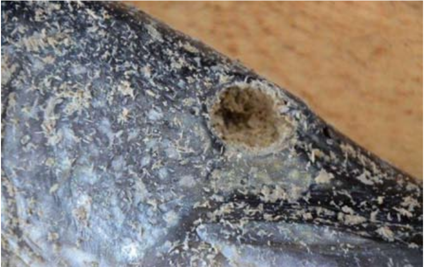
Obr. 12. Detail lícní části hlavy štiky naplněné směsí.

zůstala sypká. Poté přidáme sádro v poměru 5 l vlhké směsi : 0,5 kg sádry. Přesný poměr nelze stanovit vzhledem k druhu použitých složek. Cílem je vlhká směs, ze které se po zmáčknutí neuvolňuje tekutina.