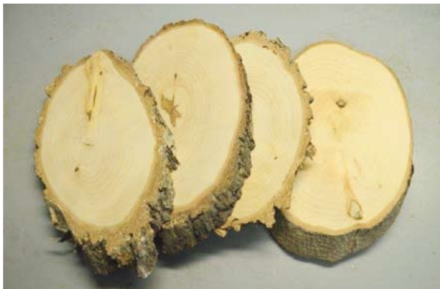
Obr. 24. Pro uchycení preparátu se používají dřevěné podložky.

Dokonale proschlý, dobarvený a přelakovaný preparát hlavy je připravený k instalaci na podložku, na které bude viset. Materiálem pro zhotovení podložky je vhodné dřevo s méně výraznou strukturou kresby. Nejjednodušší variantou je připevnění na dřevěnou podložku připravenou přímým řezem z kmene stromu včetně kůry – bříza, olše, akát, borovice apod. (obr. 24). Podložka by měla být z vyschlého dřeva, 2–4 cm tlustá, na obou stranách zbroušená a nalakovaná bezbarvým lakem.