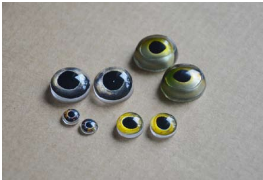
Obr. 22. Originální oči mají dokonalejší tvar a vybarvení.