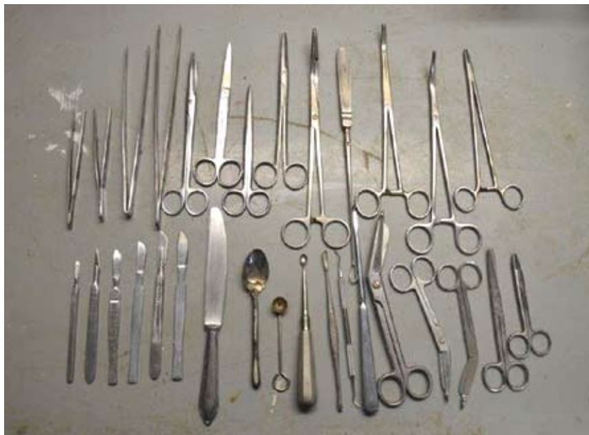
Obř. 5. Sada nástrojů používaných při preparaci rybích hlav.