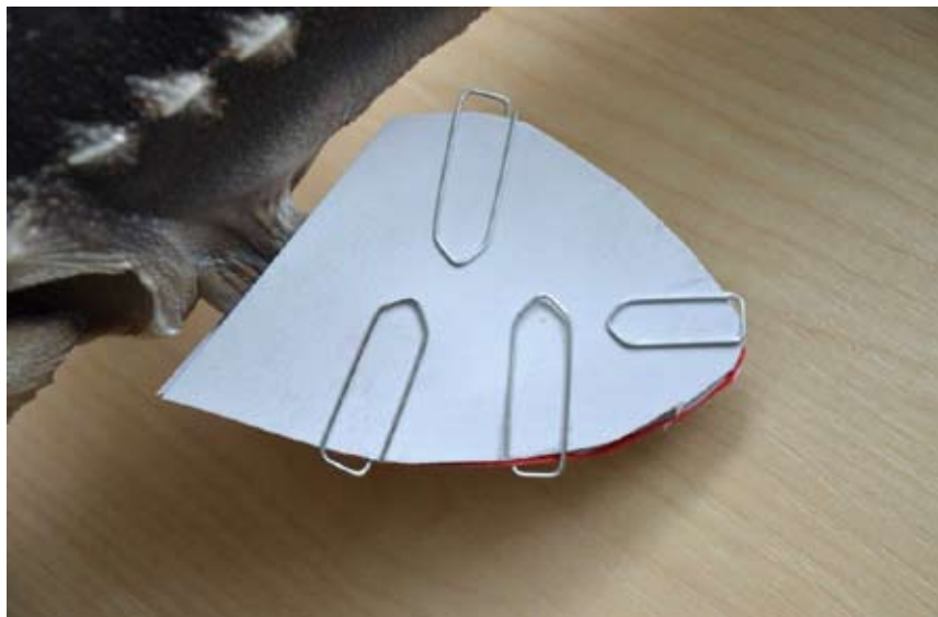
Obr. 16. Fixace ploutve jesetera do kartonu pomocí kancelářských spenek.