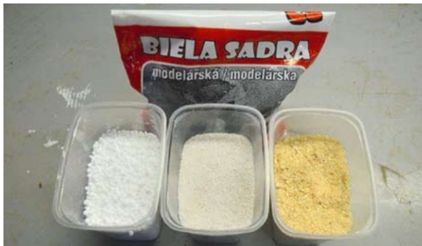
Obr. 11. Plnicí směs ze sádry a pilin vylehčíme použitím perlitu či polystyrenu.